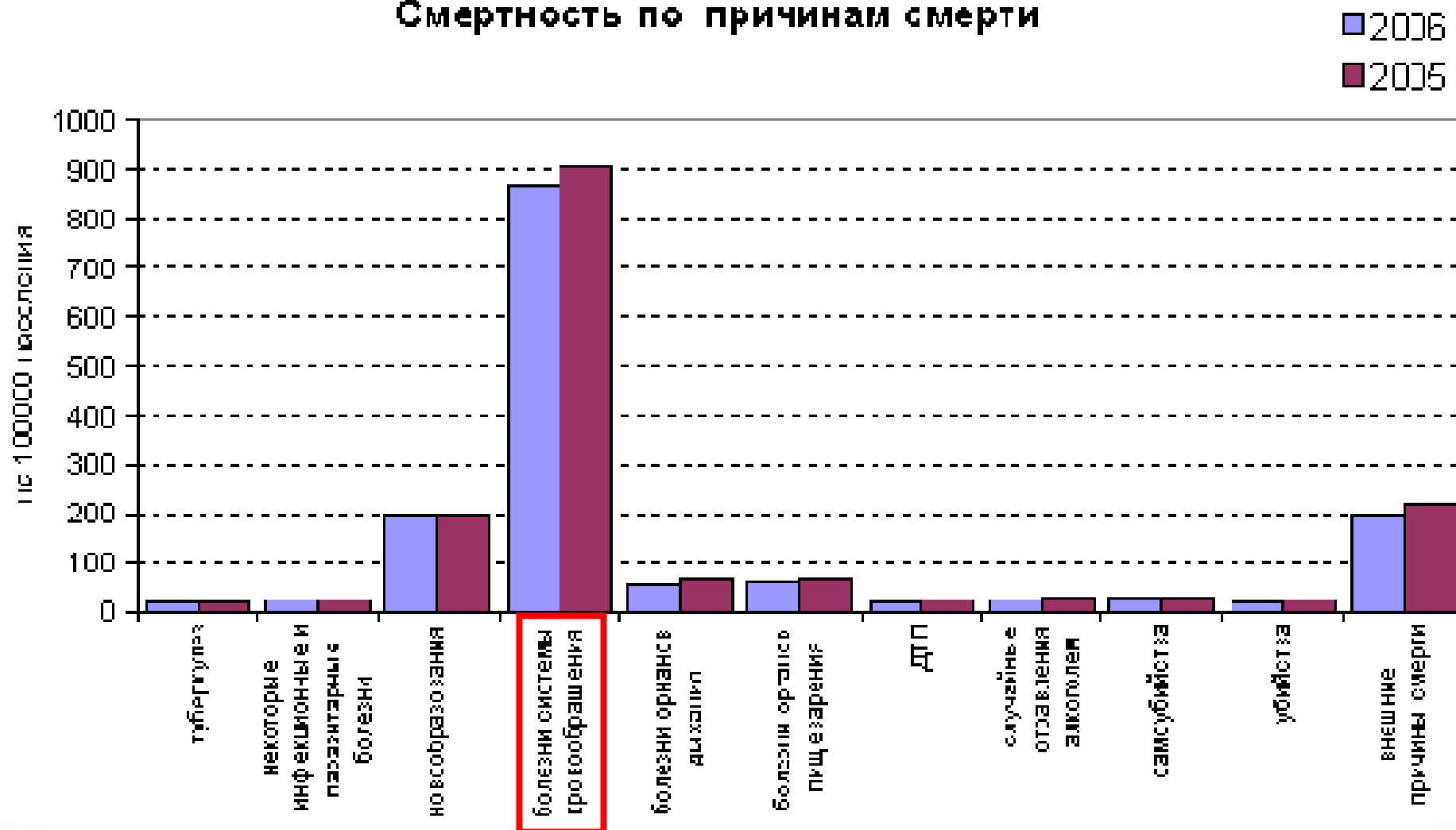
Смертность по причинам смерти